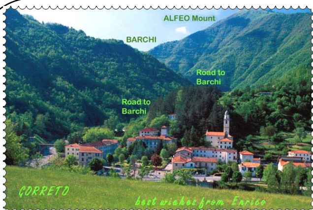
Figura 12 - Panoramica di Gorreto