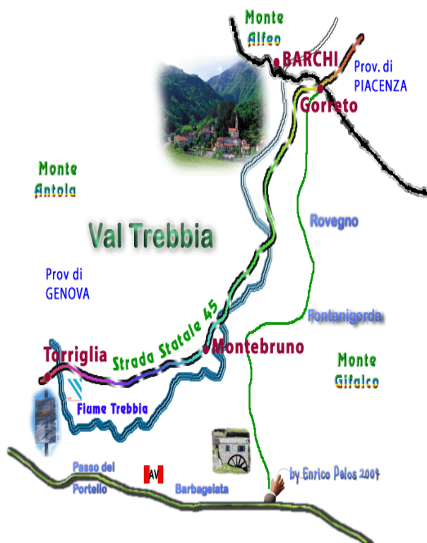
Figura 10 - Cartina della Val Trebbia (Genova) e Barchi (Piacenza)