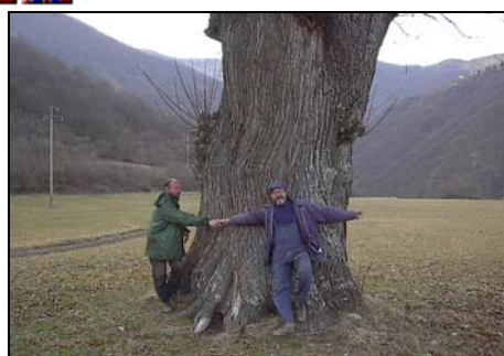
Figura 15 - "L'albero di Barchi", monumento nazionale - foto John Barchi

http://www.global.village.it/~pelos/barchi.htm